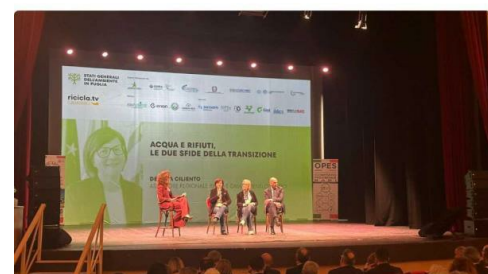
STATI GENERALI AMBIENTE IN PUGLIA - Da Bari sfida ambientale: controlli, impianti e differenziata per ridurre il divario tra Sud e Nord Turismo, ambiente, industrializzazione di raccolta, riuso e riciclo dei rifiuti. Un approccio propositivo verso l'impiantistica e una maggiore consapevolezza dei temi ambientali e dell'economia circolare. Su questi ed altri argomenti si sono svolti, a Bari, gli Stati Generali dell'Ambiente organizzati da Ricicla Tv e Zucchetti Ambiente che hanno aperto il conto alla rovescia per la settima edizione del Green Med Expo & Symposium, in programma dal 27 al 29 maggio 2026 alla Stazione Marittima di Napoli. Ricchissimo il parterre di relatori che hanno tracciato un bilancio di quanto finora fatto in Puglia per la gestione dei rifiuti e in ottica di riuso e recupero delle materie prime seconde e disegnato una prospettiva futura partendo dalle priorità. Moderati dal direttore di Ricicla Tv, Monica D'Ambrosio, si sono avvicendati sul palco del teatro Piccinni di Bari esponenti di istituzioni, imprese, consorzi, utility e associazioni.