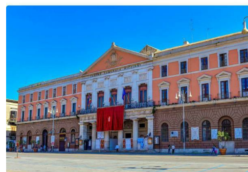
Stati Generali dell'Ambiente in Puglia, l'8 aprile appuntamento a Bari (Teatro Piccinni) Sono in programma il 8 aprile 2026 al Teatro Piccinni di Bari gli "Stati Generali dell'Ambiente in Puglia", evento dibattuto dedicato alle politiche ambientali territoriali e ai principali dossier della transizione ecologica. Quello di Bari è il quarto e ultimo appuntamento del ciclo 2025-2026 promosso da Ricicla Tv nelle regioni del Centro-Sud Italia, dopo Roma, Lamezia Terme e Messina. L'iniziativa mette a confronto istituzioni, imprese, consorzi, utility e associazioni sui nodi decisivi della sostenibilità ambientale e rappresenta un appuntamento che precede e arricchisce il Green Med Expo & Symposium, in programma dal 27 al 29